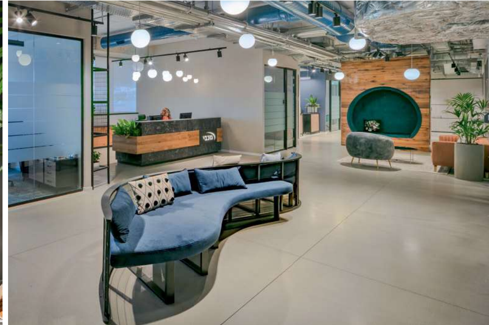
מבט אל לובי ראשי, פינות ישיבה בהשראת לוגו מכבי.

בחלל ניצבות שתי פינות ישיבה שעוצבו בקווים עגולים אשר שאבו את השראתם מהלוגו של מכבי